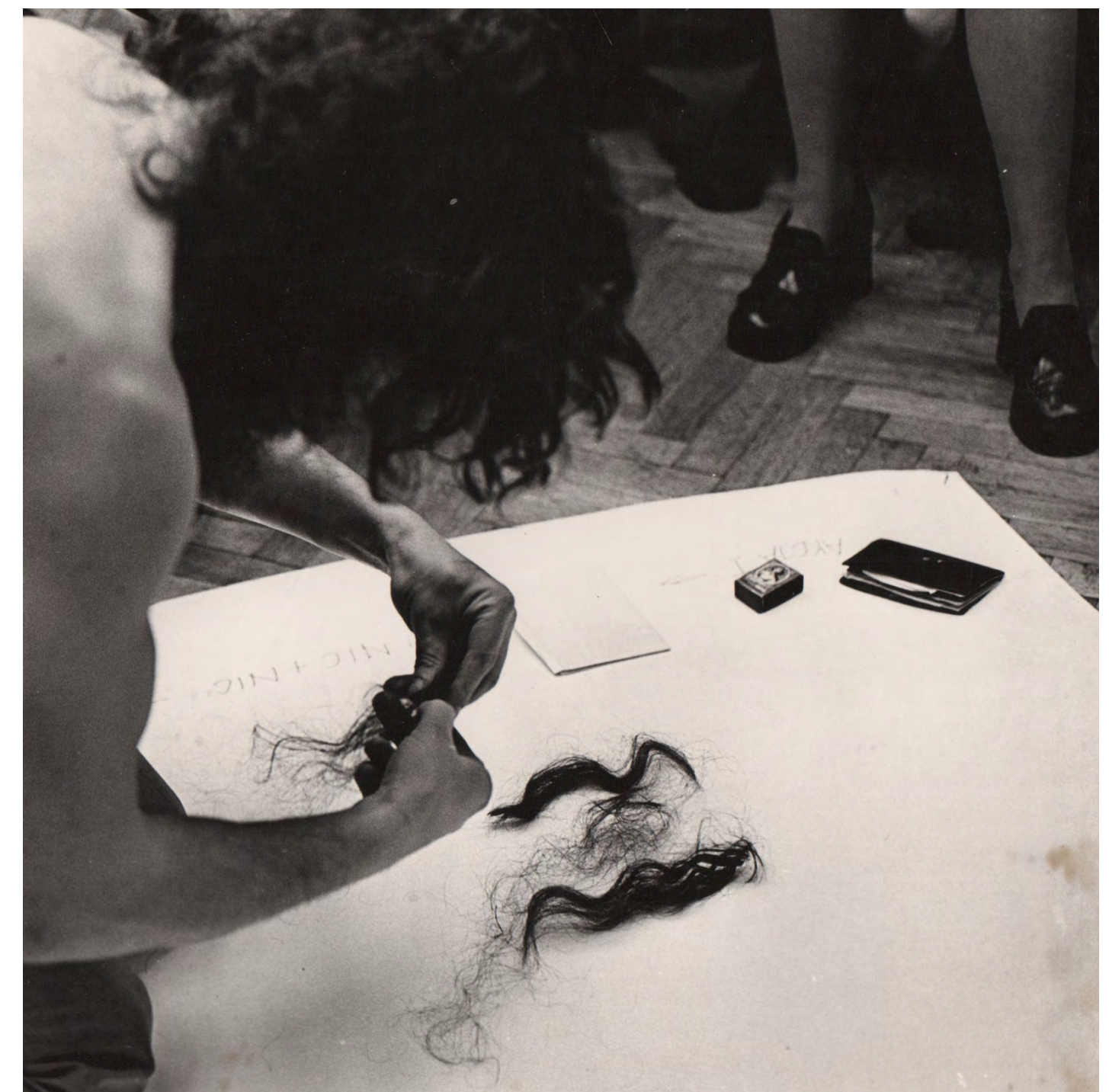
Nic + Nic + Nic + Nic , Lubelska Wiosna Teatralna, Lublin, 1973