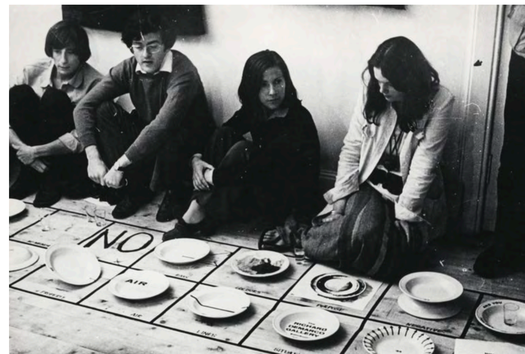
Richard Demarco Gallery, Edynburg, Wielka Brytania, sierpień 1972