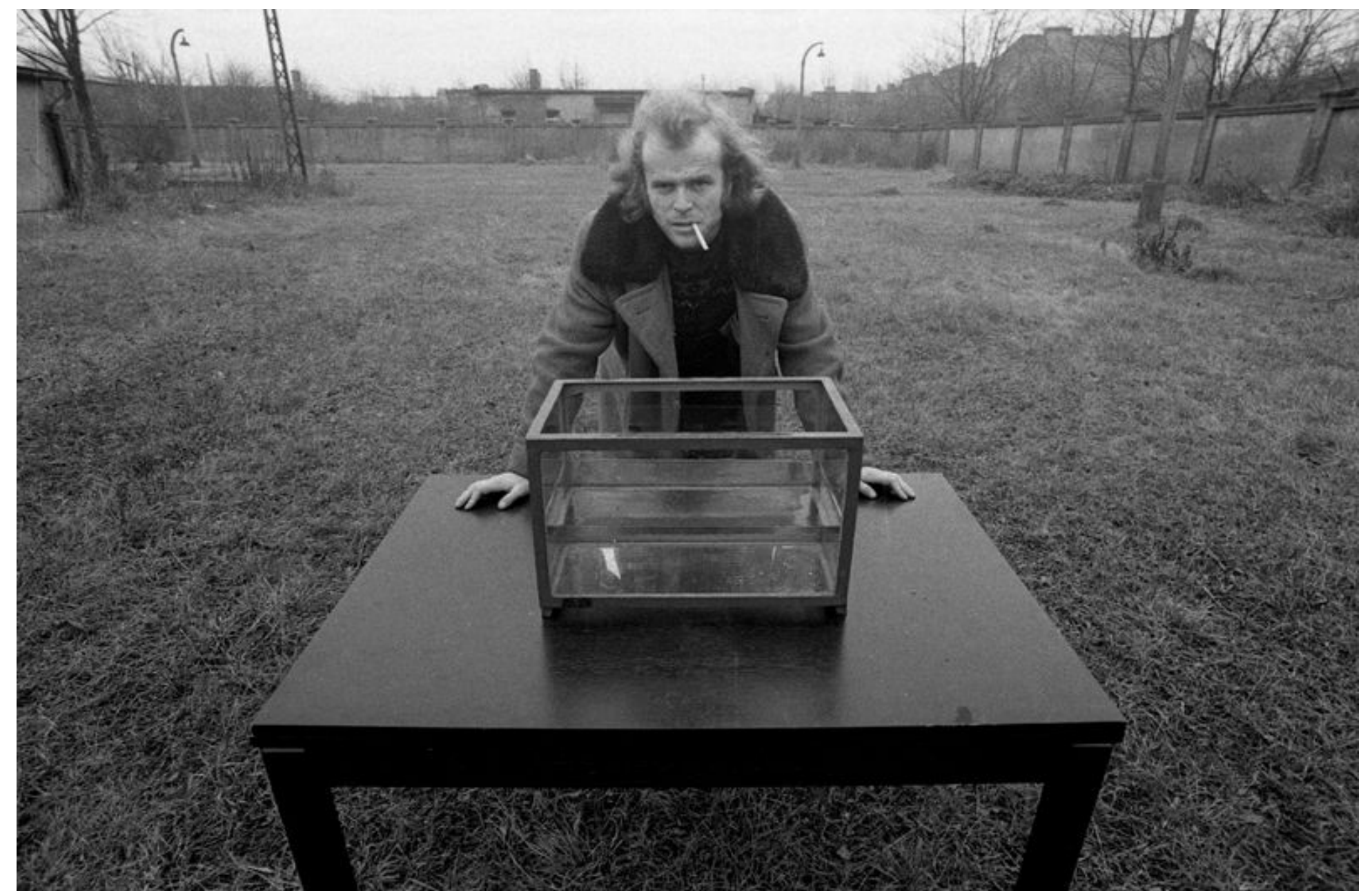
Nieinterwencja – Nic , Wytwórnia Filmów Oświatowych, Łódź, 1974