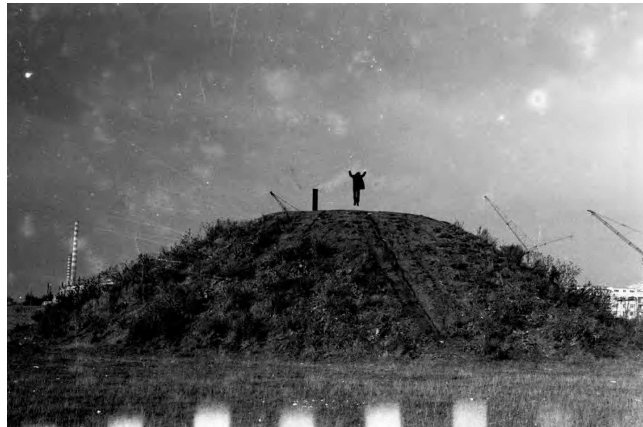
Modlitwa o Nic , Łódź, 1974

Modlitwa o Nic powstała na podstawie przekonania Warpechowskiego, że awangardowi artyści posługują się seriami fotografii dla ukazania pewnego procesu twórczego, rzadko prezentując pojedyncze zdjęcie. Artysta odwrócił tę tendencję, tworząc sytuację dla jednego, konkretnego obrazu fotograficznego, nazywając go „foto-sceną”. Jesienią 1974 roku, udał się z zaprzyjaźnionym fotografem na sztuczny pagórek w Łodzi usypany z gruzów i śmieci. Wówczas powstała seria fotografii artysty w różnych pozach, takich jak klęczenie czy podskakiwanie, rejestrowana z dołu aparatem z szerokąkątym obiektywem. Z całego filmu Warpechowski wybrał jedno zdjęcie, słabej jakości technicznej, z prześwietleniami i rysami i powiększył je do formatu 70 × 100 cm. Praca została zaprezentowana na wystawie grupowej w Lyonie, obok dzieł artystek i artystów takich jak Niki de Saint-Phalle czy Jean Tinguely.