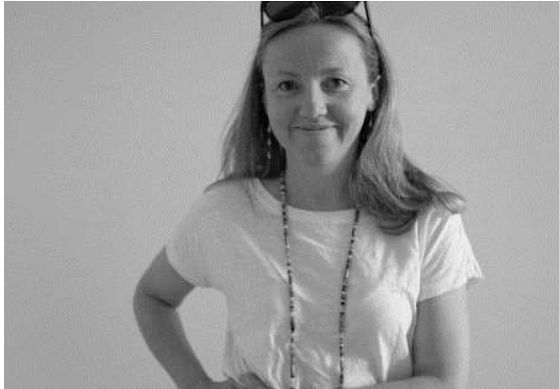
Fot. Alicja Gielniowska