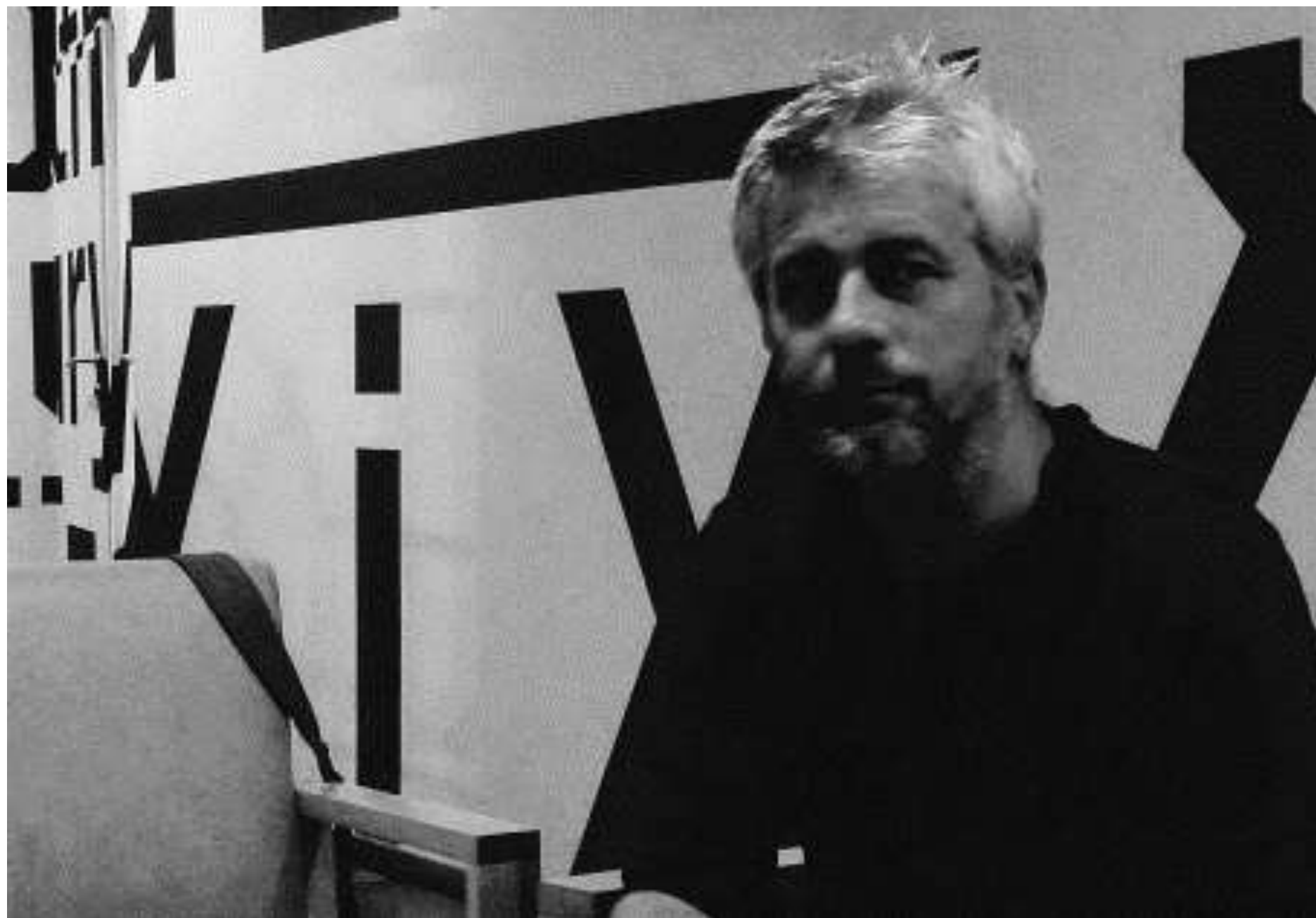
Archiwum Praffdata: zdjęcia z „War-Show” w kinie Tęcza w grudniu 1993 roku