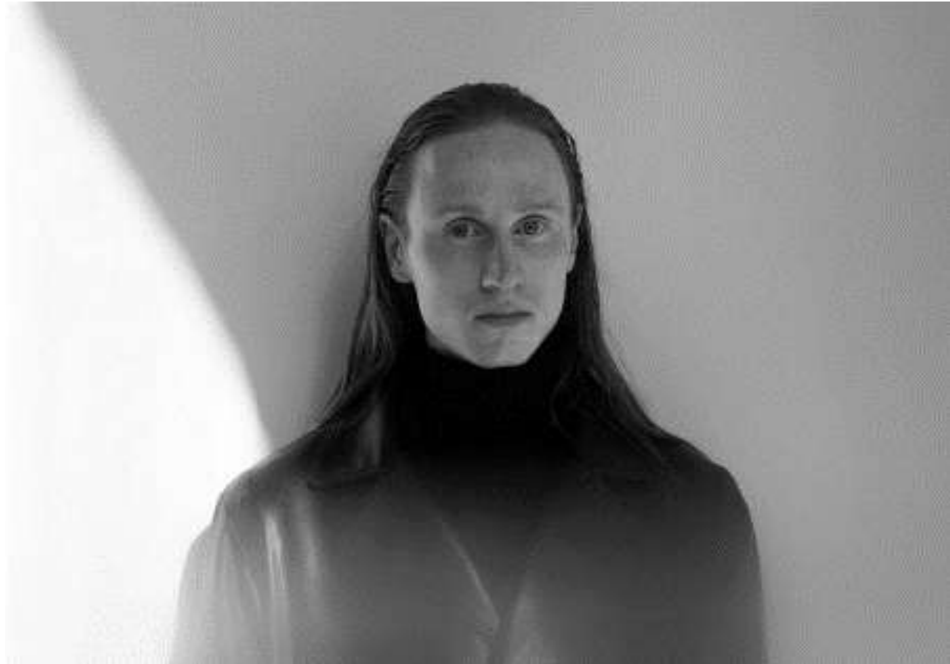
Fot. Ola Osowicz Kapsel