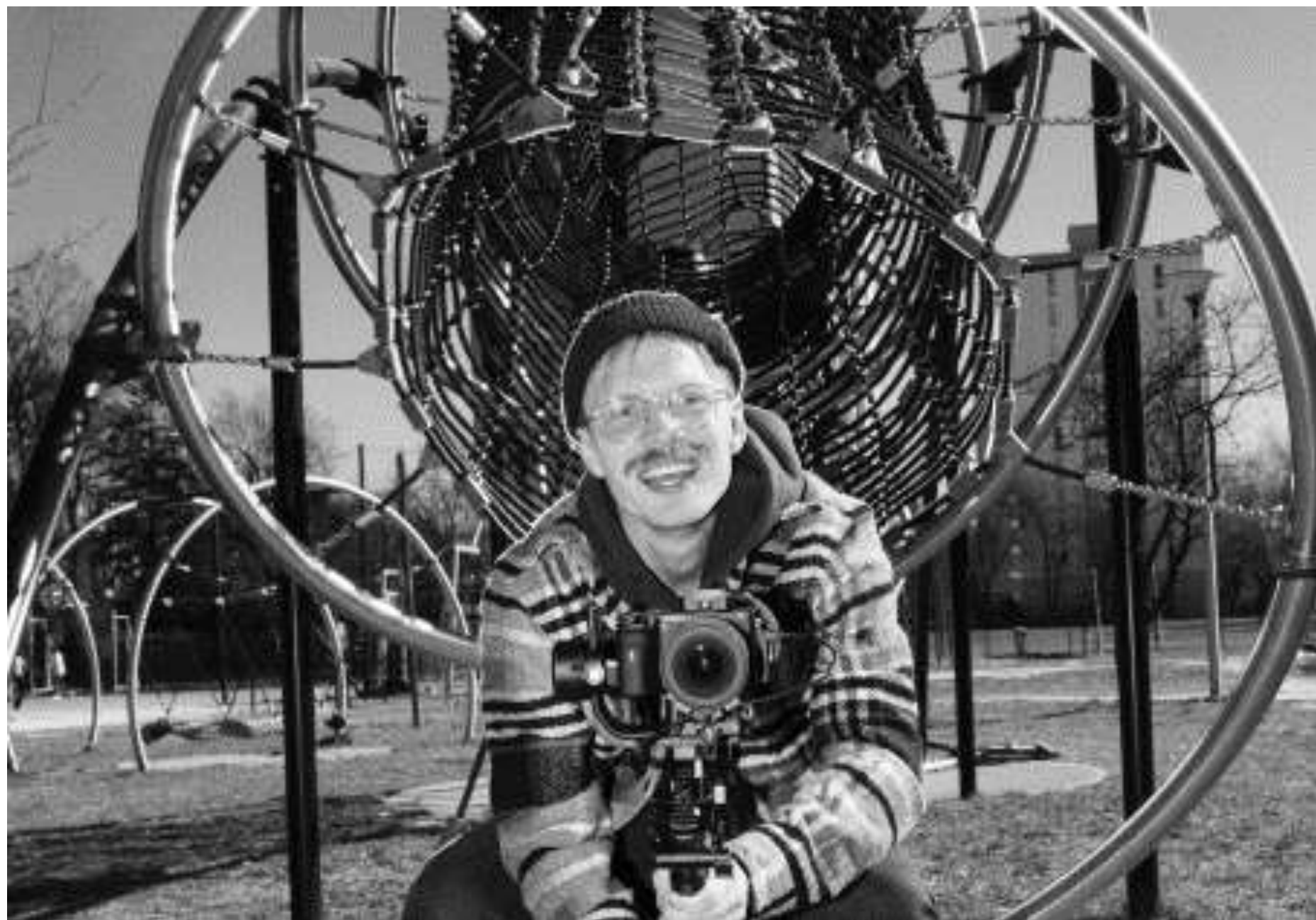
Fot. Karolina Wojtas