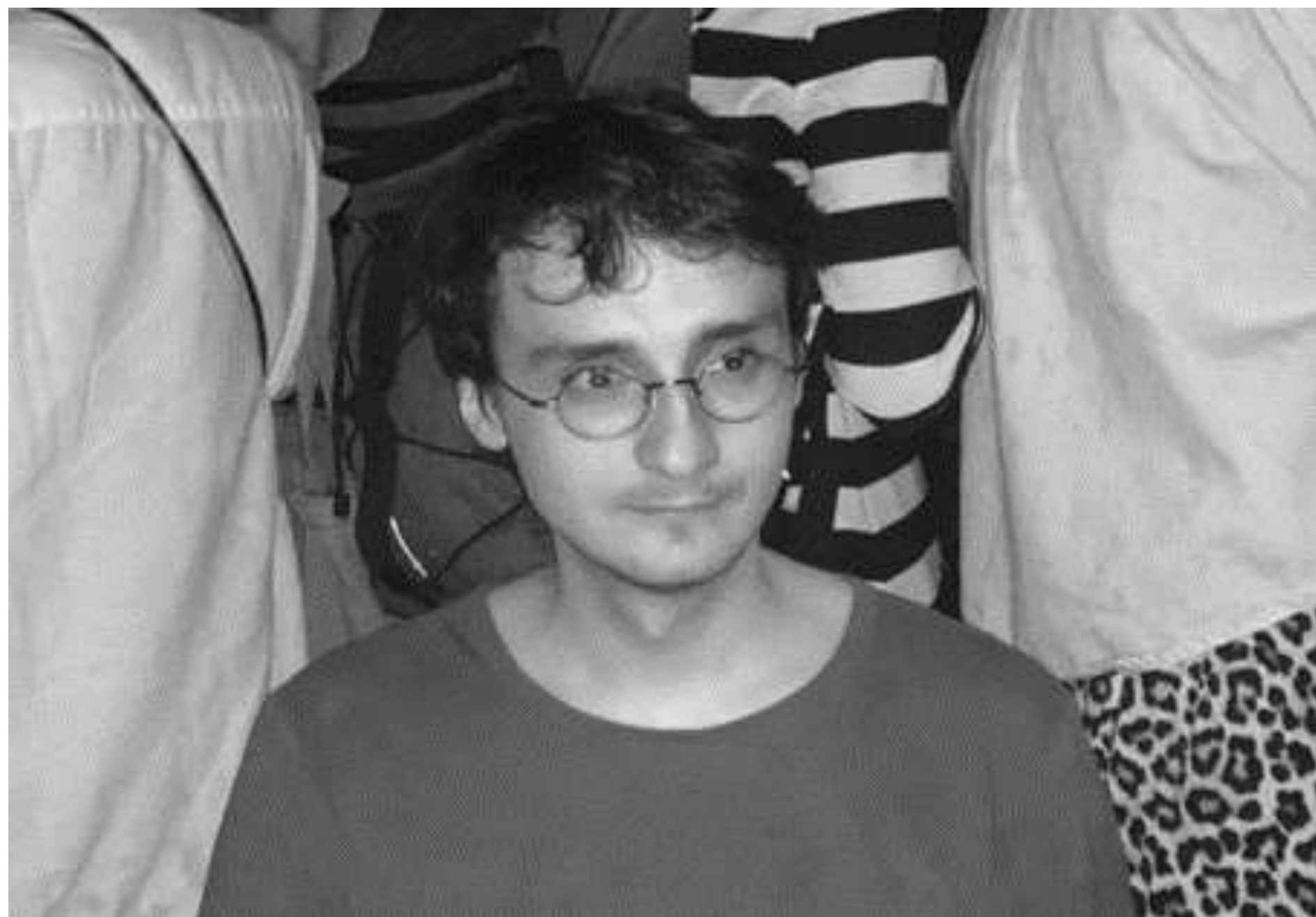
Fot. Irmina Rusicka